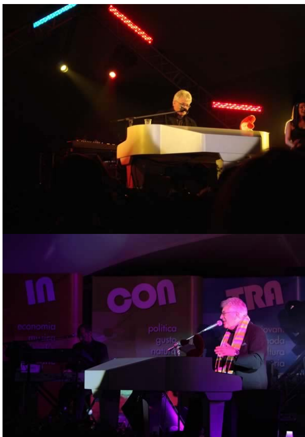
Peppino di Capri durante il concerto a Cortina