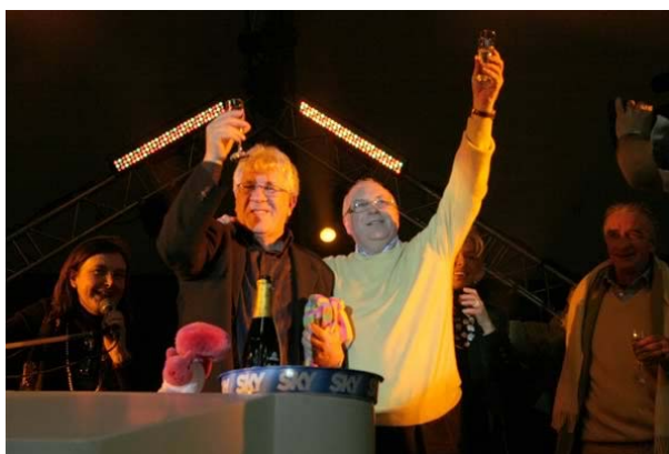
Peppino di Capri durante il concerto a Cortina

“Siamo molto soddisfatti della risposta del pubblico alle nostre proposte invernali, più concentrate rispetto all’estate, dove abbiamo più tempo per l’approfondimento quotidiano e la varietà di contenuti”, spiega Enrico Cisnetto, ideatore della manifestazione, “e questo significa che il marchio è sempre più riconoscibile per la qualità e originalità delle proposte e non è solo più riferibile al grande contenitore estivo”.