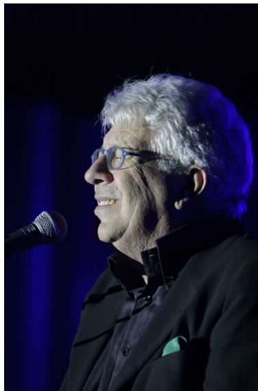
Peppino di Capri

Autentica icona della musica italiana, Peppino di Capri il 5 Gennaio, in un applauditissimo concerto, ha ripercorso alcuni classici del suo repertorio, dalla tradizione napoletana ai ritmi più rock e soprattutto il twist: da “ Champagne ” a “ Saint Tropez ”, da “ Luna Caprese ” a “ Let’s twist again ” e “ Don’t play that song ”, e ancora molte altre canzoni che hanno segnato il panorama musicale italiano e non solo, per una serata che è stata davvero indimenticabile. A conclusione, sulle note di “ Champagne ”, un brindisi con tutti gli spettatori per un augurio di Buon Anno.