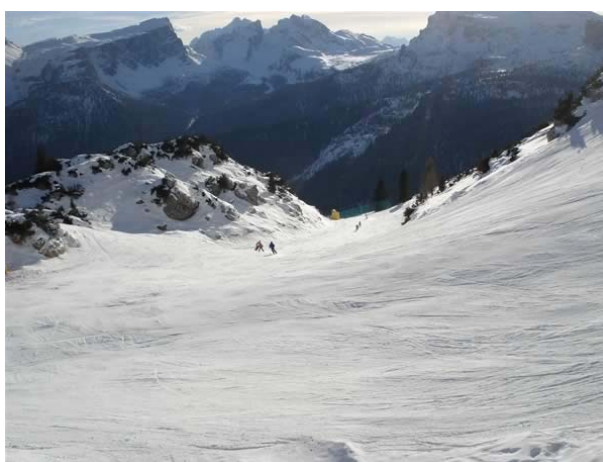
una pista di Cortina, a quota 2400 metri