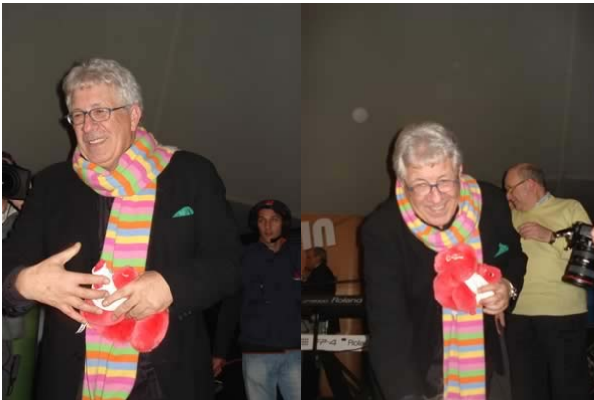
Il cantante stringe le mani al pubblico con lo scoiattolo di peluche, simbolo di Cortina d'Ampezzo