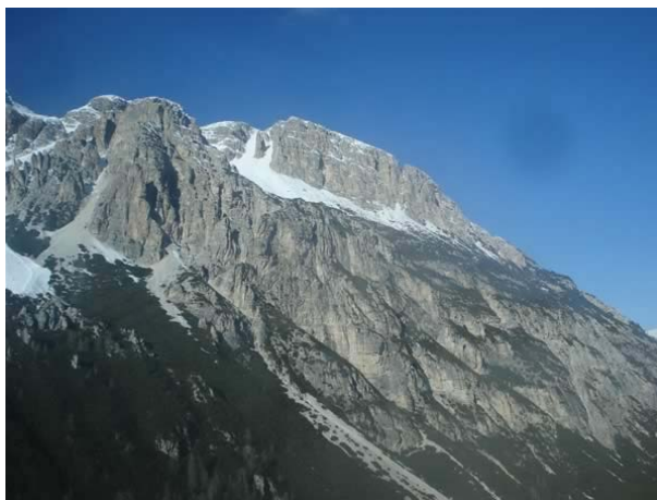
Una cima delle Dolomiti Ampezzane

Venerdì 4 gennaio, due giorni prima della Befana, è arrivato direttamente da Topazia , l'isola dei topi, Geronimo Stilton . Insieme all'inseparabile amico d'infanzia Ficcanaso Squitt , il Topo più amato dai bambini ha raccontato storie da ridere, più tenere della mozzarella, più gustose del groviera, più saporite del gorgonzola...proprio storie con i baffi che hanno divertito grandi e piccini.