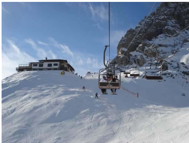
L'arrivo di una seggiovia