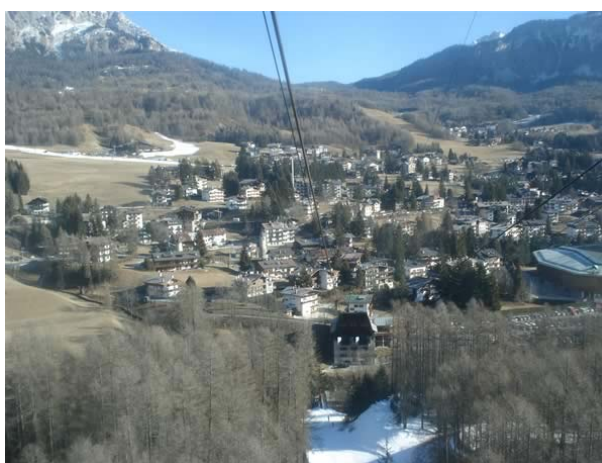
Cortina vista dalla funivia Freccia nel Cielo

Per il secondo progetto è intervenuta la generosità del pubblico di “ Cortina InConTra ”: la raccolta fondi di quest’edizione di Cortina InConTra, oltre 12.000 Euro, sarà devoluta al “ Progetto Laboratorio e Banca del Sangue ”, per il reparto pediatrico dell’ Ospedale di Ngozi, in Burundi , struttura sostenuta dalla Fondazione Pro-Africa , un’associazione fortemente voluta e presieduta dal cardinal Tonini e in collaborazione con l’ Università degli Studi di Verona . Anche per la versione invernale “ Cortina InConTra ”, ha potuto contare su una forte visibilità mediatica.