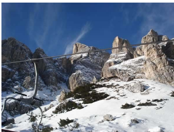
un costone del massiccio delle Tofane