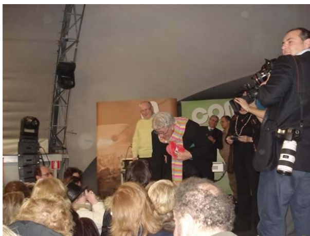
brindisi e strette di mano al termine de concerto